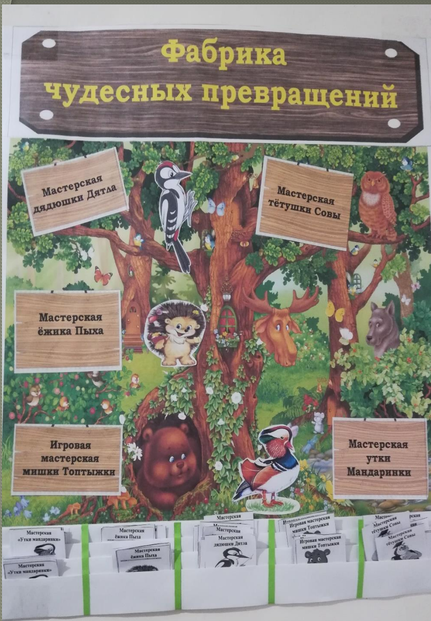
График работы площадки